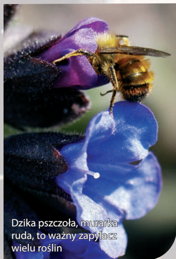
Dzika pszczoła, murarka ruda, to ważny zapylacz wielu roślin

miasta to nasi sprzymierzeńcy w walce z innymi owadami lub zwierzęta oddające nam nieocenione usługi w zapylaniu roślin uprawnych: pól, sadów i ogrodów.