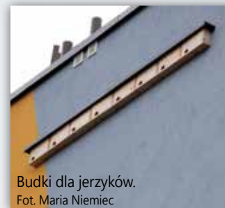
Budki dla jerzyków.