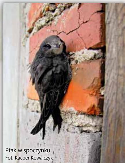
Ptak w spoczynku