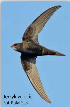
Jerzyk w locie.

Jego budowa zainspirowała konstruktorów niewykrywalnego samolotu typu Stealth . W powietrzu jedzą, piją krople wody, śpią, zbierają materiał na budowę gniazd, polują z szeroko otwartym dziobem, a nawet kopulują!