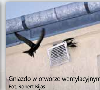
Gniazdo w otworze wentylacyjnym.