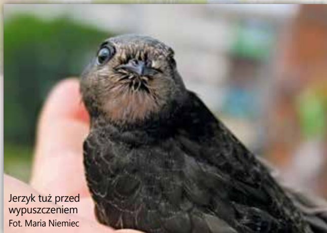
Jerzyk tuż przed wypuszczeniem

Odchowanie młodego ptaka jest trudne i bardzo czasochłonne – wymaga dużej wiedzy i cierpliwości. Powinny się tym zajmować osoby odpowiednio przeszkolone w opiece nad ptakami.