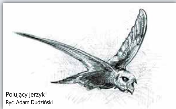
Polujący jerzyk Ryc. Adam Dudziński