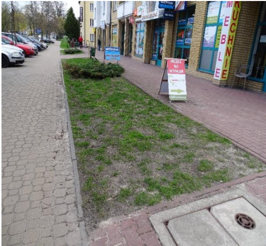
Stan przed zagospodarowaniem