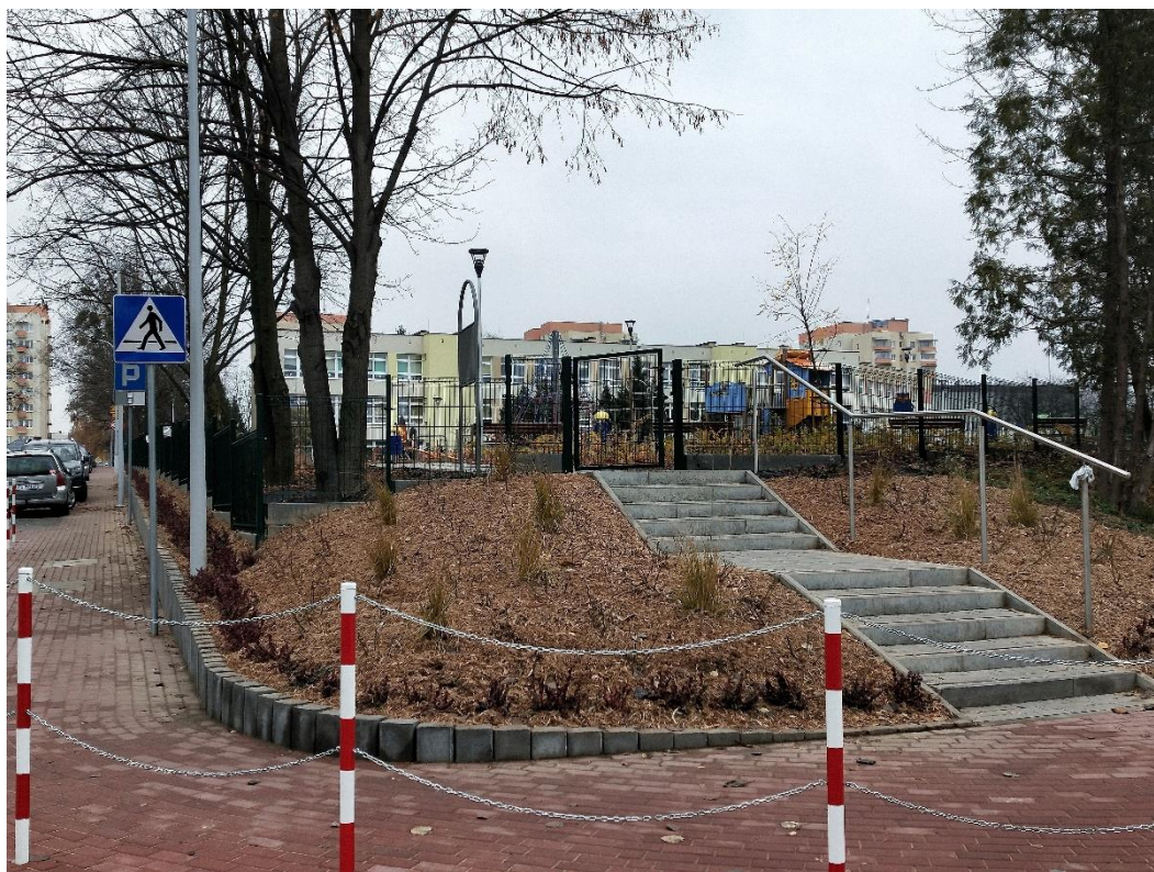
Stan po wykonaniu nasadzeń