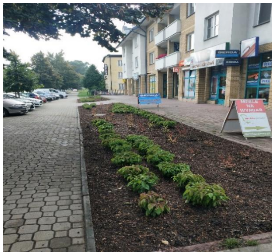
teren po posadzeniu krzewów