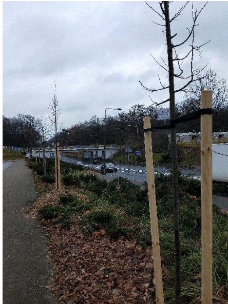
doga do PKP