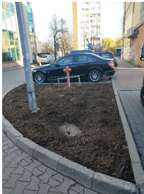
Stan przed i po nasadzeniach