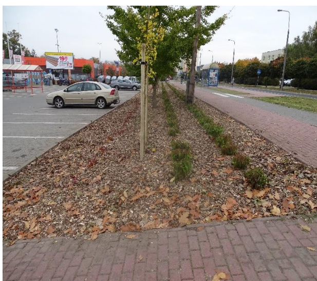
Stan przed i po nasadzeniach