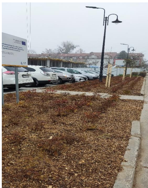
Stan przed i po wykonaniu prac ogrodniczych